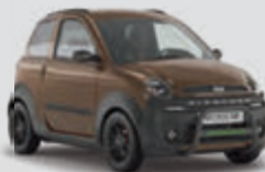
M.Go Highland X