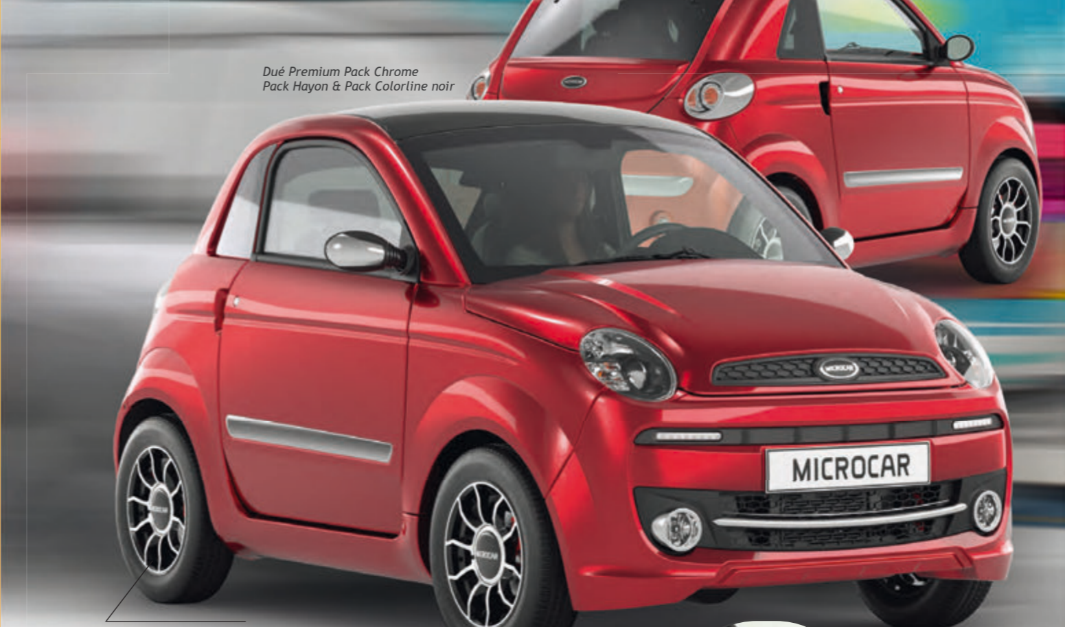
Duē Premium Pack Chrome Pack Hayon & Pack Colorline noir