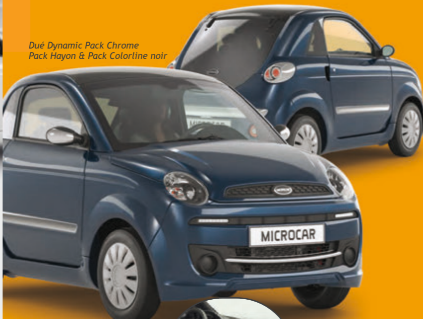
Duē Dynamic Pack Chrome Pack Hayon & Pack Colorline noir